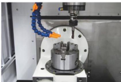
傾斜円テーブル (三爪チャック取り付け例)